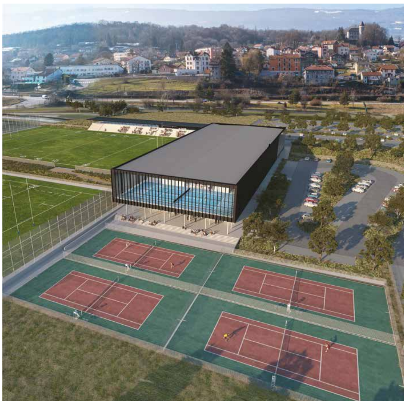
LA PLAINE D'ARLOD

« Ce dossier pèse près de 18 millions d'Euros hors taxe, maîtrise d'œuvre comprise. Deux axes de financement :