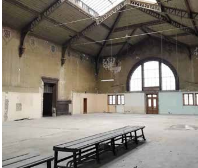
SALLE DE VISITE

2021, la salle débarrassée de ses constructions intérieures