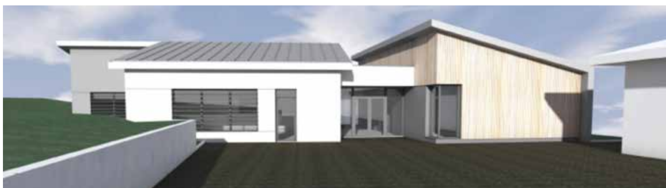
ECOLE DE VOUVRAY

leur apprentissage. Le projet est ensuite présenté en conseil d'école. Cela nous permet d'expliquer aux parents quelles sont les solutions retenues avec les arguments avancés au fil des réunions, une vraie démarche de concertation. »